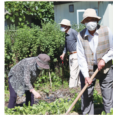
■畑仕事…ちょっとひとやすみ！

現在、ケアハウスでは20名の方が、日々のんびりと過ごしていらっしゃいます。さて、どのように過ごされているのか？ ちょっとおじゃましました。