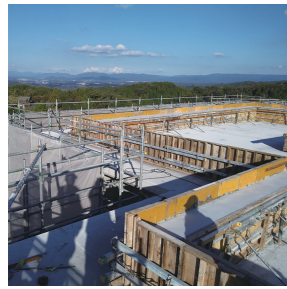
■建設中の屋上からの眺望

山添村に来年4月、特別養護老人ホーム『つつじの丘』を開設します！と前月号「すずのね vol.8」でお知らせしました。今回は、さらに詳しくご紹介します。